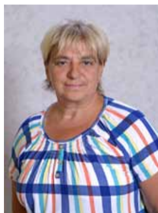
НАДЕЖДА ВЛАДИМИРОВНА САВИНОВА